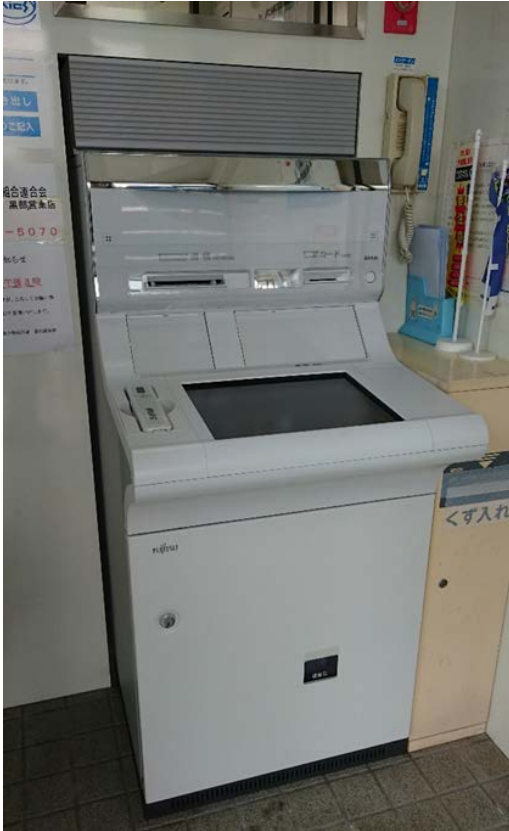
(写真は、黒部のATMです。)